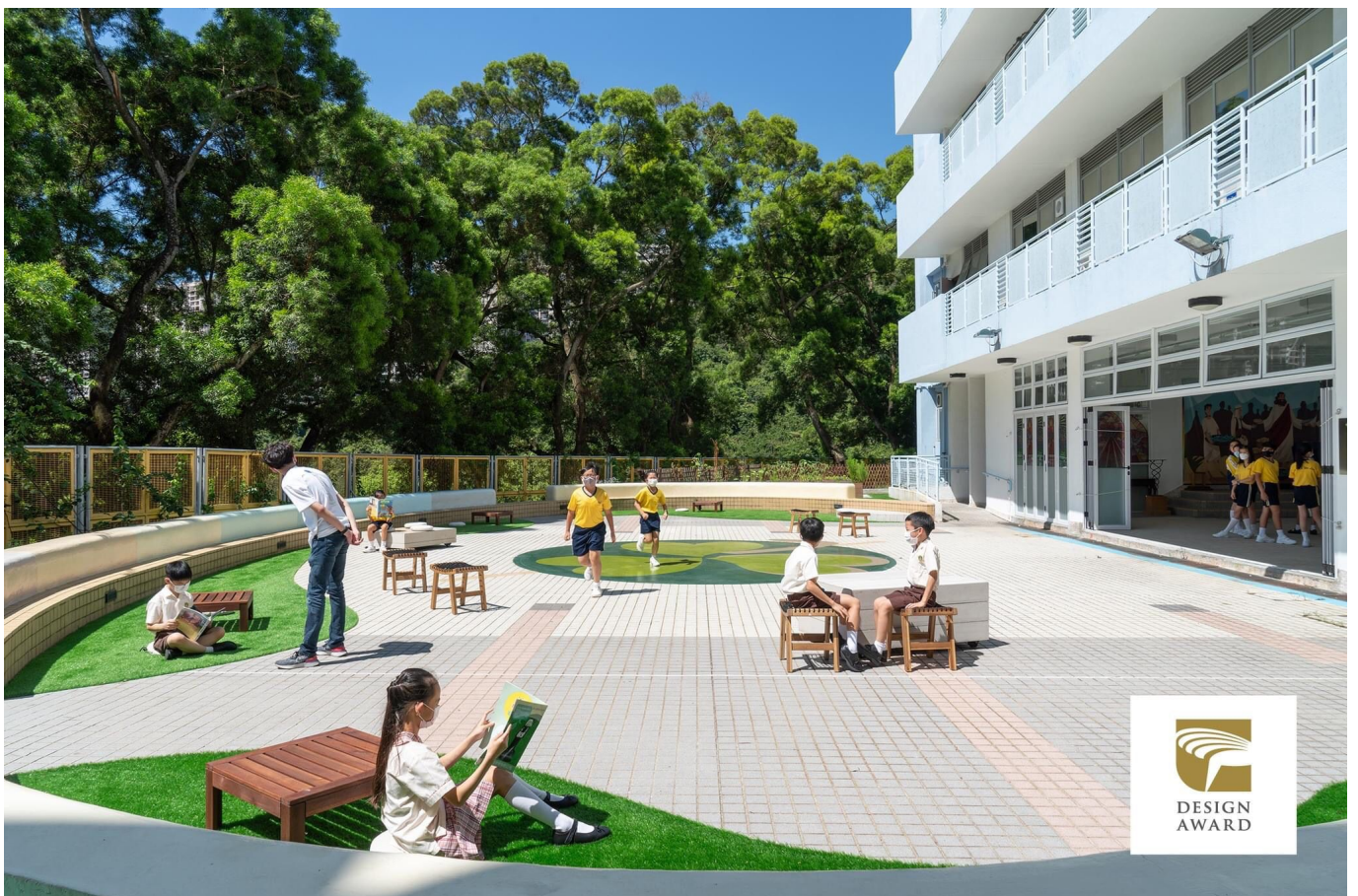
聖公會偉倫小學：師生思考如何讓「動」與「靜」、「個人」與「群體」等不同需求，透過分區的方法，靈活兼容。