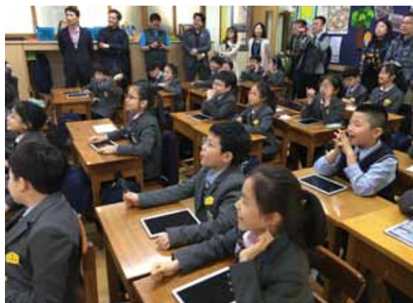
校長及老師一行人到當地小學觀課，為推廣電子學習取經。

HKT Education多年來協助過百間學校鋪設網絡基建、引入電子學習資源，更積極向老師提供培訓及研討會，從師資入手推動電子學習。在今年復活節，HKT Education更與香港Samsung合辦為期4天的STEM首爾體驗交流團，帶領一眾中小學老師、校長衝出香港。除了到韓國觀課、與當地師生交流外；又到訪Suwon Digital City並遊覽Samsung Innovation Museum，親身接觸最新的科技及產品。交流團完結後，老師、校長們再次同聚於分享會上，把當日的見聞及心得整合，為推廣電子學習作準備。