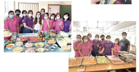
家長義工協助中六溫習日營

2021年 6月-7月 校服也環保 本會鼓勵同學愛護地球，善用資源，上年度因疫情關係暫停舉行，延至本年派發。上年存貨及本年回收共約150件環保校服，由家長義工協助整理，在7月本校同學領取了18件校服，而中一新生則領取了100件校服。