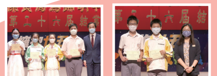
下學期 學業成績優異獎

全年 家長教育及學生升學資訊轉發服務 為推動家長教育，並提供升學資訊，本會在網頁 ( http://www.plkkmkc.edu.hk >家教會>最新消息)不時更新相關的訊息。本會又提供家長教育及學生升學資訊電子郵件轉發服務。