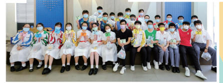
下學期考試溫習周打氣活動

全年 獎學金 本會贊助學校「優秀學生獎勵計劃」，又設立「操行獎」、「學業成績優異獎」、「品德躍進獎」和「學業成績進步獎」，藉以獎勵在學業和品行方面有良好表現、積極進取的學生。