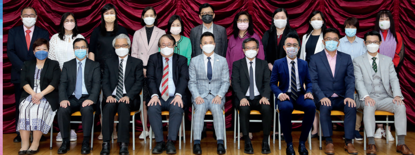
▲敬師運動委員會2022/23年度委員合照